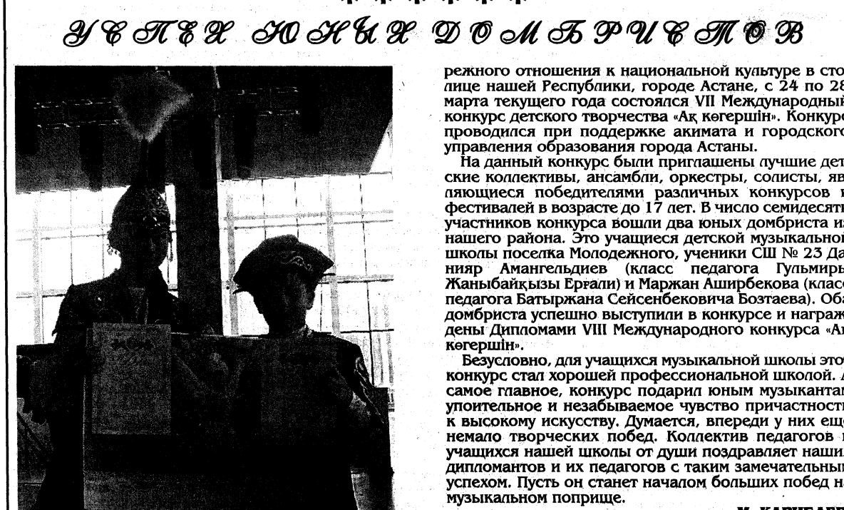
В целях повышения роли внешкольных организаций в развитии личности ребенка, воспитания бе-

Караганды облысы Осакарор ауданы әкімдігінің 2013 жылғы 22 сәуірдегі №21/01