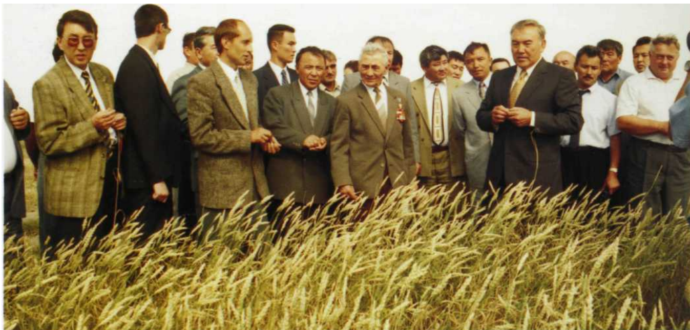
Елбасы Н.А. Назарбаев Осакаров ауданының дикандарымен бірге. Президент РК Н.А. Назарбаев с хлеборобами в Осакаровском районе.